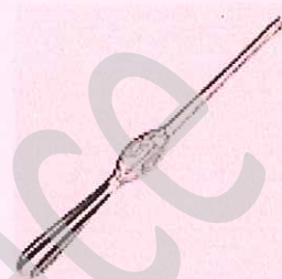
Curette à homard